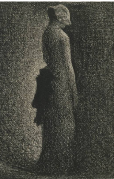
Le nœud noir