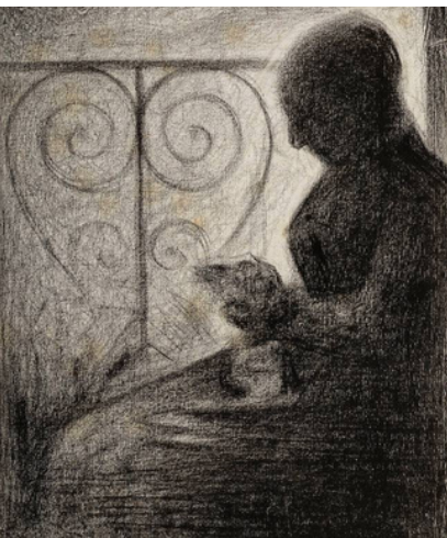
Devant le balcon