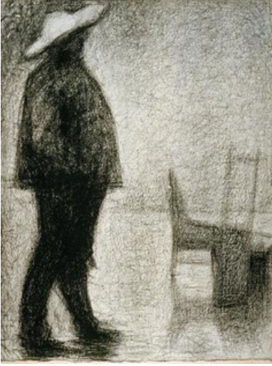
Le transporteur de marchandises