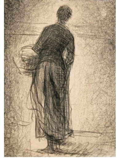
La femme au panier