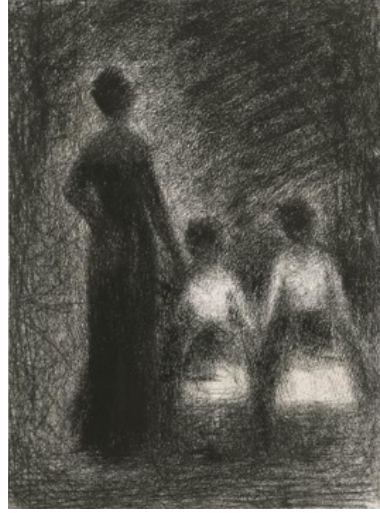
Femme avec deux fillettes