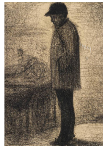
Le marchand d'oranges